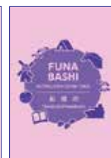
英語版 (左) と中国語版 (中) とベトナム語版 (右) の表紙